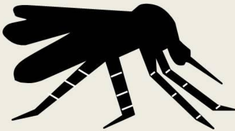
埃及斑蚊 & 白線斑蚊 Aedes aegypti Aedes albopictus