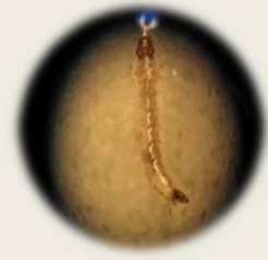
埃及斑蚊及其子子 特徵：胸部背板之側緣有一對銀白色之吉他狀曲線，中間有一對狹長之黃白色直線

登革熱 (Dengue fever)，俗稱「天狗熱」或「斷骨熱」，依據不同的血清型病毒，分為 I、II、III、IV 四種型別，如果患者感染其中一型，只會對該型免疫，仍有機會得到另外三型，以感染第 2 型最危險，易發生出血性登革熱。