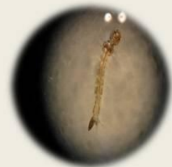
白線斑蚊及其子子 特徵：胸部背板中間，僅有一條寬而直的銀白線